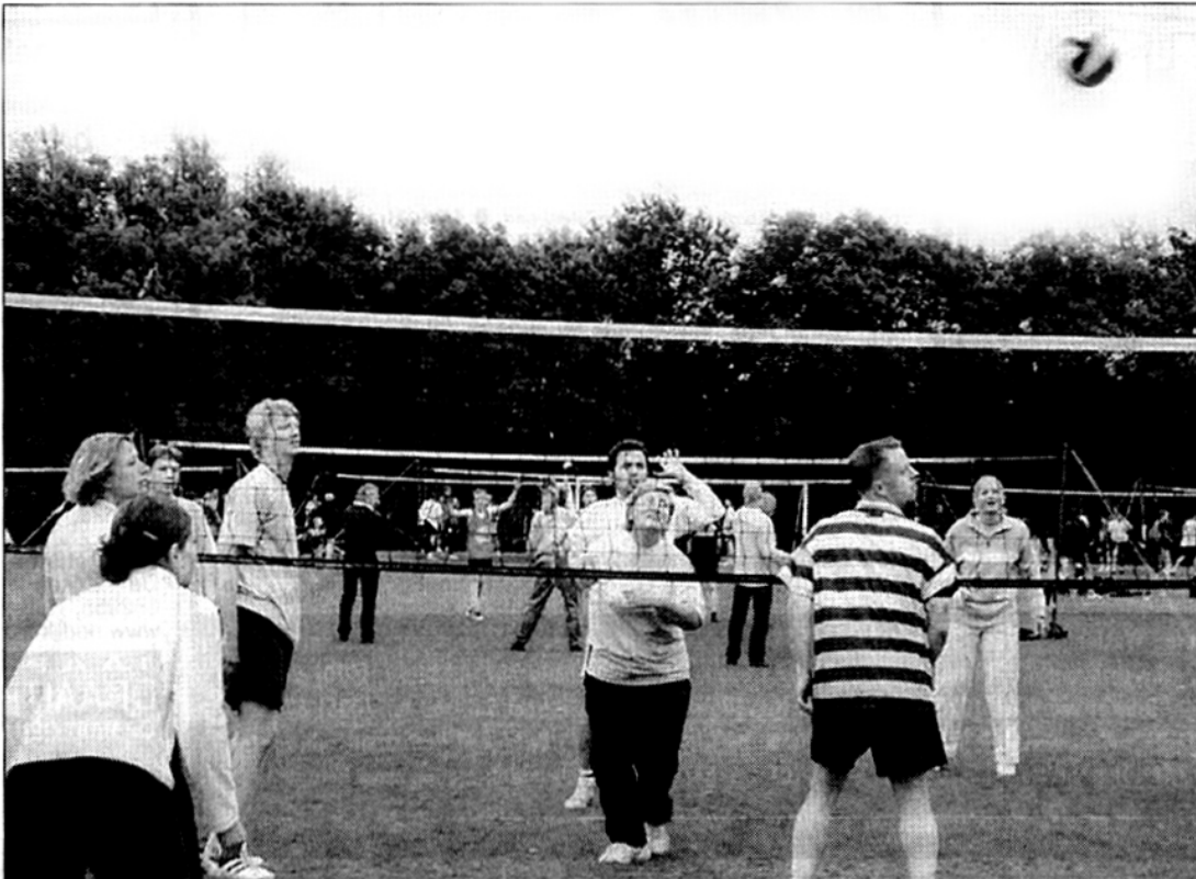
Het Krovo toernooi is elk jaar weer een doorslaand succes